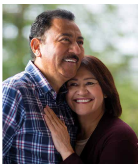
Asistencia Funeral 360