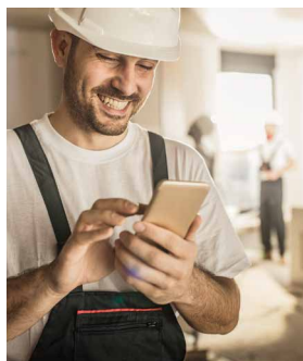
Asistencia Protección Hogar