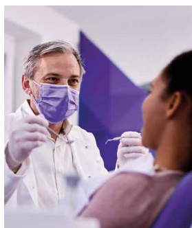
Asistencia Odontológica 360