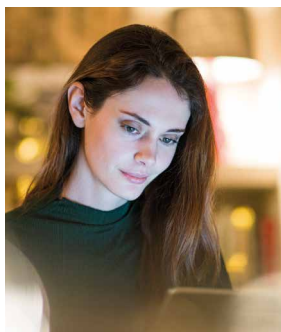
Asistencia Luz 360 Plus