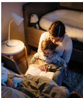
Asistencia Luz 360