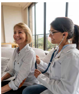
Asistencia Doctor 360